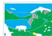
ed. La Spatule

Mon parcours professionnel est celui d'une pure scientifique. La bande dessinée est venue sur le tard. Adolescente, je dessinais des mains et des trucs abstraits