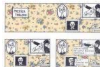
travail personnel, éd. La Spatule

Comment juges-tu aujourd'hui la formation que tu as reçue ? (progrès, difficultés...) Sur quoi as-tu essayé de travailler en particulier ? (scénario, dessin, découpage...)